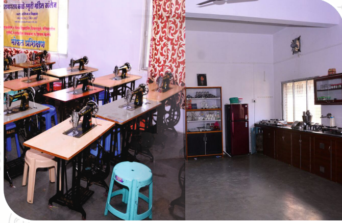
मृहअर्थशास्त्र व फॅशन डिजायनिंग प्रयोगशाला