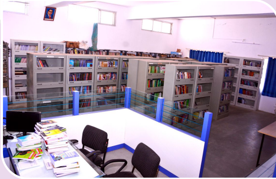
सुसज्ज ग्रंथालय व वाचनकक्ष