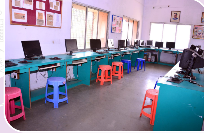
संगणक व भाषा प्रयोगशाला