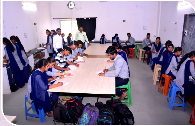
पदार्थ विज्ञान प्रयोगशाला