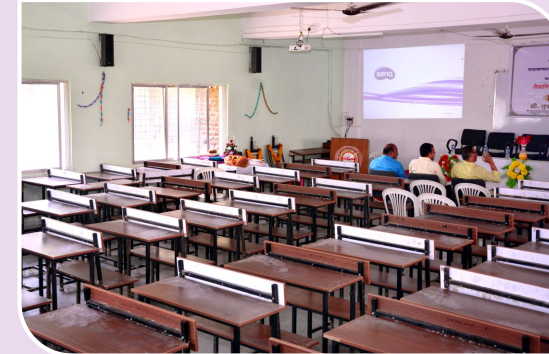
डिजीटल क्लास रुम